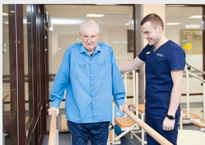
Качество ухода и активизация